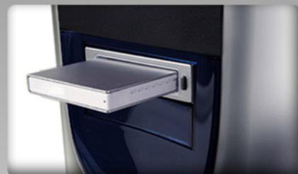
Intern & Extern - Die flexible Speicherlösung