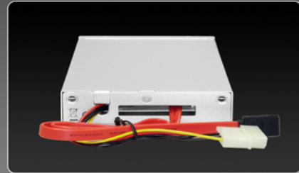
Intern SATA für bis zu 300 MB/Sek.