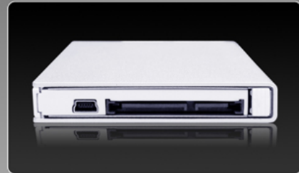
Extern SATA & USB 2.0 Kombination